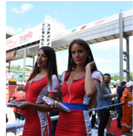
PIT LANE WALK